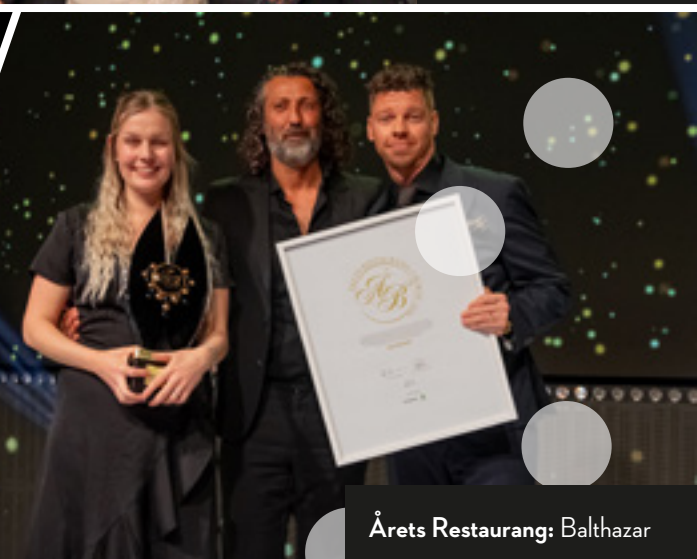
Årets Restaurang: Balthazar