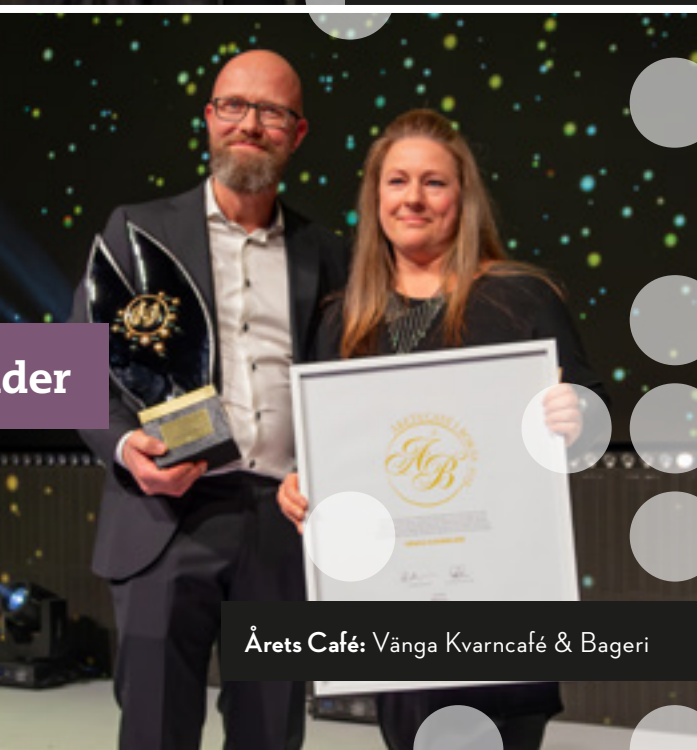
Årets Café: Vånga Kvarncafé & Bageri