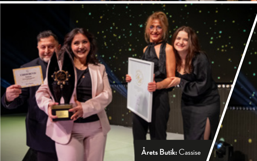
Årets Butik: Cassise