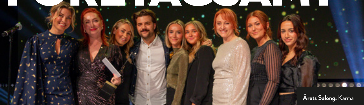
Årets Salong: Karma