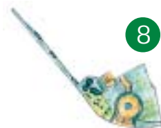
8 Vid Krokfallsberget finns blomsterarrangemang vid stenbranten mot stationen och en liten lund strax ovanför.