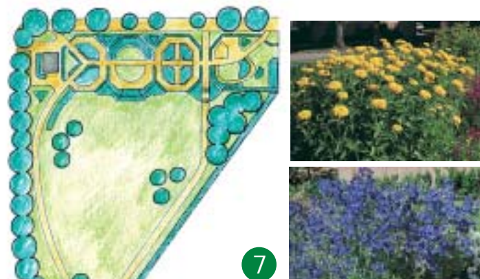
7 Majorslunden från 1940-talet renoverades 1993 och fick stora planteringar med 125 sorters perenner.