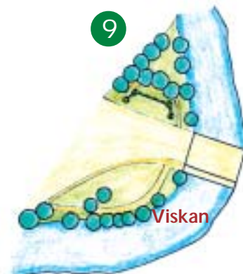
Nybroparken utnyttjar en av Viskans krökar genom Borås för en lummig och skuggig paus i stadsvimlet.