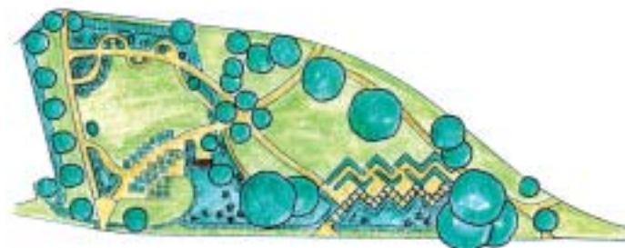
4 Almasparken rustades upp 1997. Den formades på temat Sinnenas park - syn, hörsel, doft och smak.