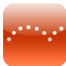
Appen Ping Pong mobile

Om du byter namn, adress eller telefonnummer berättar du det i receptionen så snart som möjligt så att skolan kan nå dig med aktuell information.