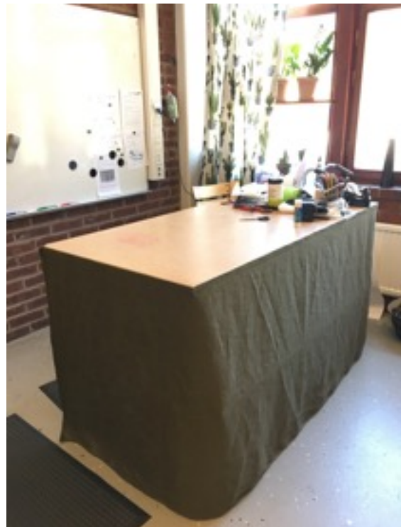
Katedern fick sig en ansiktslyftning