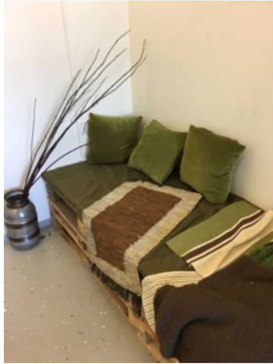
En soffa byggdes av pallkragar.