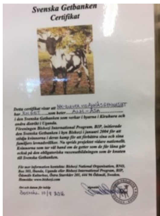
Vår get, som döptes till Alm-Åsa.