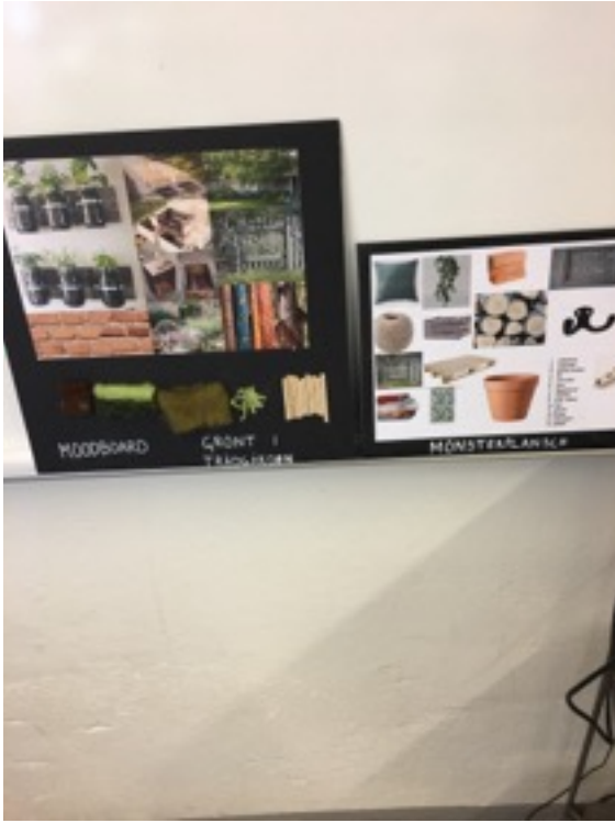
Moodboard till ett av klassrummen.