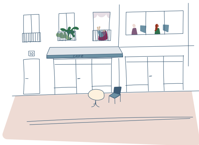
Stad i ögonhöjd med med publika bottenvåningar, entréer mot gatan och blandat innehåll.

I bottenvåningar är det av stor vikt att möjliggöra för verksamhetslokaler. Detta innebär till exempel att bottenvåningar utformas med större rumshöjd och att det finns möjlighet för större skyltfönster. Om det inte bedöms finnas någon bärighet för en verksamhet kan lokalen i bottenplan istället inhysa till exempel cykelförråd, tvättstuga, miljörum eller, sett i större skala, en förskola eller liknande verksamhet. Om lokalen utformas med fönster och bra kontakt mot gatan utanför kommer funktionerna inne i huset ge gatan trygghet och liv även om de inte innehåller en publik verksamhet. Att lekfullt berika omgivningen genom till exempel konstnärlig utsmyckning, fasadbelysning, vattenlek eller andra inslag ger en avväpnande relation mellan projekt och omgivning som upplevs som inbjudande och överraskande.