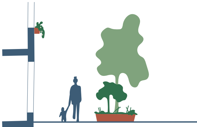
Exempel på hur grönska skapar trevliga gaturum och verkar för mänsklig skala.

Träd i stadsmiljön har många positiva egenskaper. Förutom att de ger skugga och förbättrar luftkvaliteten, har de även en funktion som skalreferens. Ett träd i gaturummet relaterar till den mänskliga skalan och kan agera som en brygga mellan människan och byggnaden, vilket bidrar till ökad trivsel.