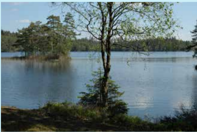
Vy över Abborrsjön