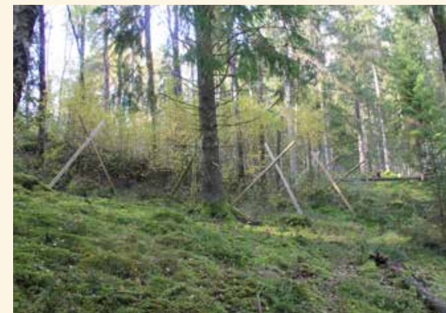
I hägnen lyckas lövträdens förnyring.

Två av orsakerna till att detta är en plats där oceaniska lavar kan trivas är att asp har funnits här under lång tid och att luftfuktigheten är hög. För att de skyddsvärda lavarna ska kunna leva kvar här behöver det ske en aspförnyring och de aspar som finns här behöver få möjlighet att kunna växa och bli gamla. Ett stort problem är att granskogen håller på att ta över. Granarna har den positiva effekten