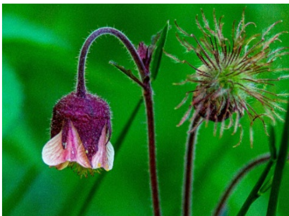
Gökblomster, Mandelblom och Humleblomster. Några av de vackra örterna på ängen.

Välkomna till en 2-3 timmars vandring i den vackra o spännande miljön. Leden går på stigar som till dels är urgamla men även på vägar och utmed ängar. Den har kommit till genom samarbete mellan Västkuststiftelsen, markägarna och Fristads Naturskyddsförening med stöttning av Borås stad och Fristads Hembygdsförening