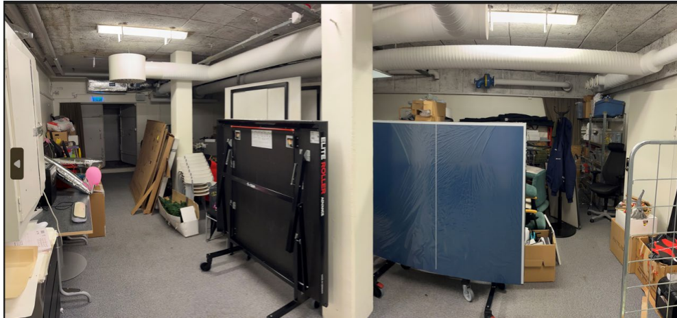
Norrbyhuset, exempel på skyddsrum.