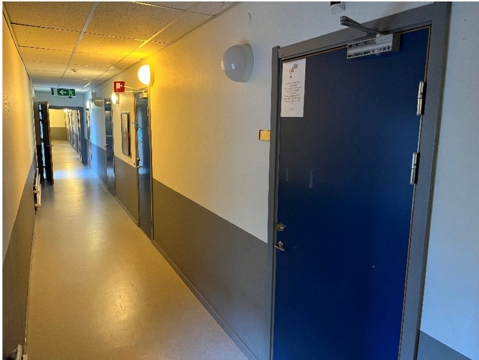
Almåshallens korridor med åtta omklädningsrum och korridorsavskiljning.