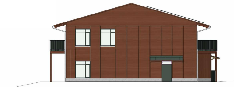
Fasad mot Sydväst