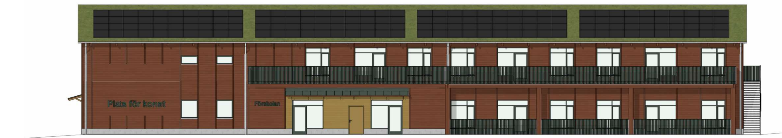
Fasad mot Sydost (Barnhemsgatan)