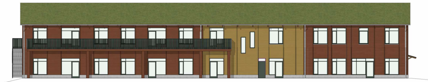
Fasad mot Nordväst