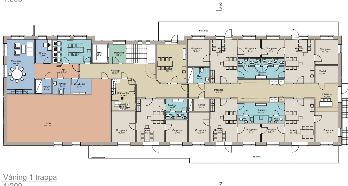
Våning 1 trappa 1:200