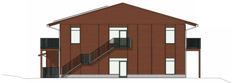
Fasad mot Nordost