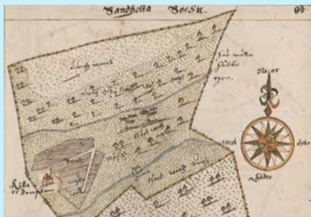
Äldsta kartan är från 1646.

Det tidigast kända namnet på Källeberg är Källartomten, dokumenterat redan 1545. I mitten av 1600-talet blev det ett säteri här. Säteriet kallades för Källeberg. Namnet Källartomten levde också kvar ända in på 1900-talet. Säteriet omfattade flera av de närliggande gårdarna. Säteriet Källeberg fanns åtminstone mellan åren 1660 – 1906. Säteriet ägdes i nästan 100 år av den adliga familjen Drakenberg. Det finns också flera kartor bevarade från de senaste 400 åren.