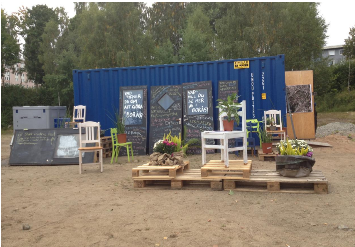
Bild från den tillfälliga mötesplatsen på Norrby under Kretsloppsveckan 2013.

Innovationsplattform Norrby fanns mellan 2013 och 2015 och var ett samarbete mellan Borås Stad, Borås Energi och Miljö, SP Sveriges Tekniska Forskningsinstitut och Högskolan i Borås. Inom ramen för innovationsplattform Norrby genomfördes två tillfälliga mötesplatser på Norrby under kretsloppsveckorna i september 2013 respektive 2014. Mötesplatserna var framförallt en del av arbetet med planprogrammet för Nedre Norrby som Samhällsbyggnadsnämnden arbetade aktivt med under dessa år. Inputen från de boende på Norrby som besökte mötesplatserna är dock värdefull för en större del av Norrby. Resultat som framkom var en önskan om aktiviteter i lokaler och aktiviteter utomhus samt fler mötesplatser. Exempel på förslag som kom in var café och festlokaler, fritidsgård för både äldre och yngre, stor park, loppis och lekplatser.