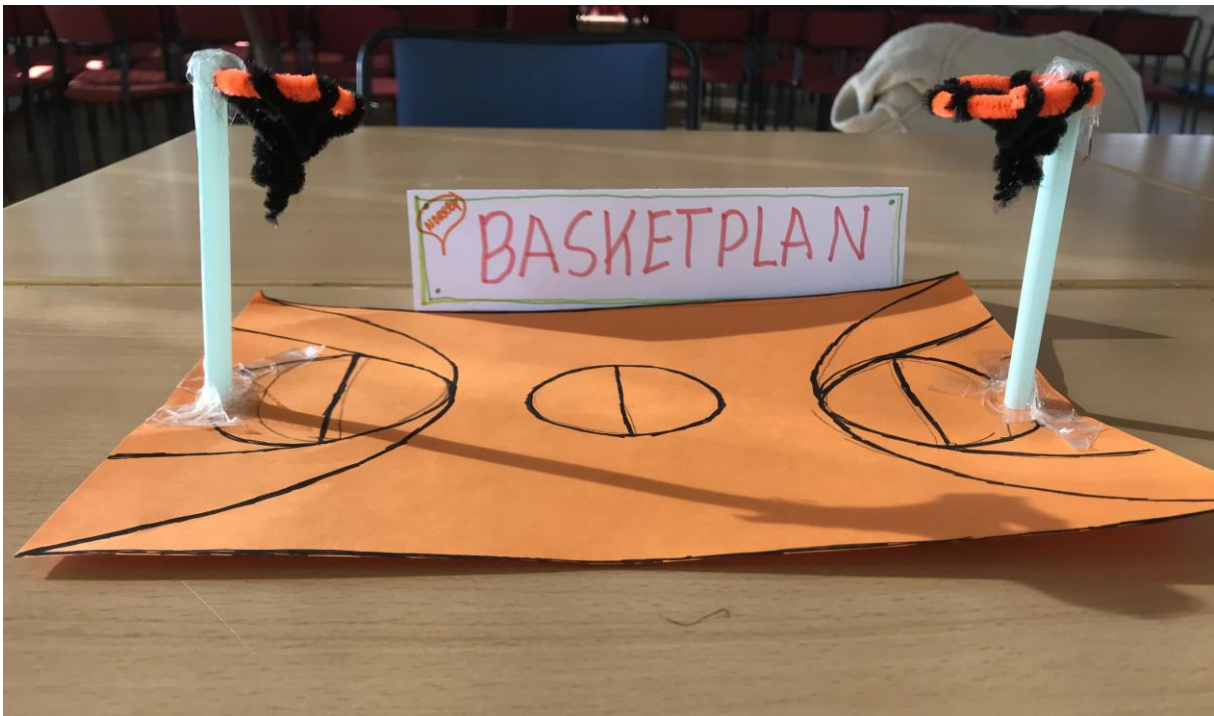
Bilder som visar ett par av de idéer som kom upp under dialogerna och som gestaltades av deltagarna.