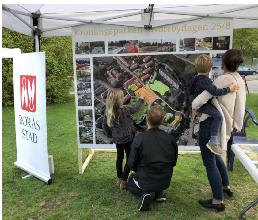
Bild från Norrbydagen 2018.

Norrbys områdespolis fanns också på plats på Norrbydagen och berättade för oss om deras perspektiv. De platser som framförallt är otrygga i området är kullen bakom Norrbyhuset och fotbollsplanen. Kullen är otrygg, med olaglig handel och många platser att gömma sig. Fotbollsplanen bidrar till mycket bråk. Polisen lyfte också, liksom de boende, trafikstrukturen som problematisk. För att öka tryggheten i parken måste den inredas med annat än buskar som riskerar att skapa dolda och mörka platser. Det är också bra med höj- och sänkbara pollare som hindrar otillåten trafik.