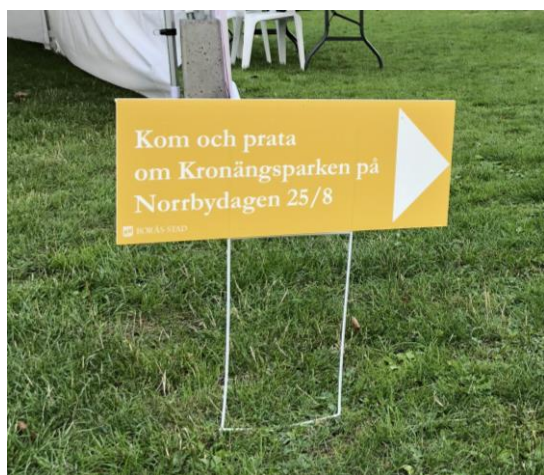
Marknadsföring inför Norrbydagen 2018.