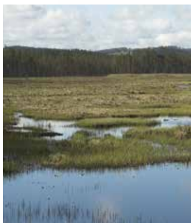
Säveån med mader