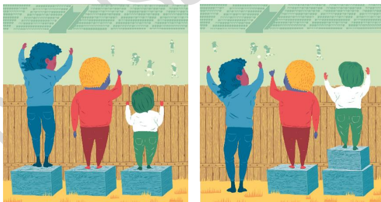
Proportionell universalism. 15

En viktig utgångspunkt för arbetet med framtagandet av samverkansavtalet har också varit proportionell universalism. Det vill säga att insatser till föräldrar bör vara universella och riktade till alla, men samtidigt vara proportionella till de behov som finns i utsatta grupper. 14