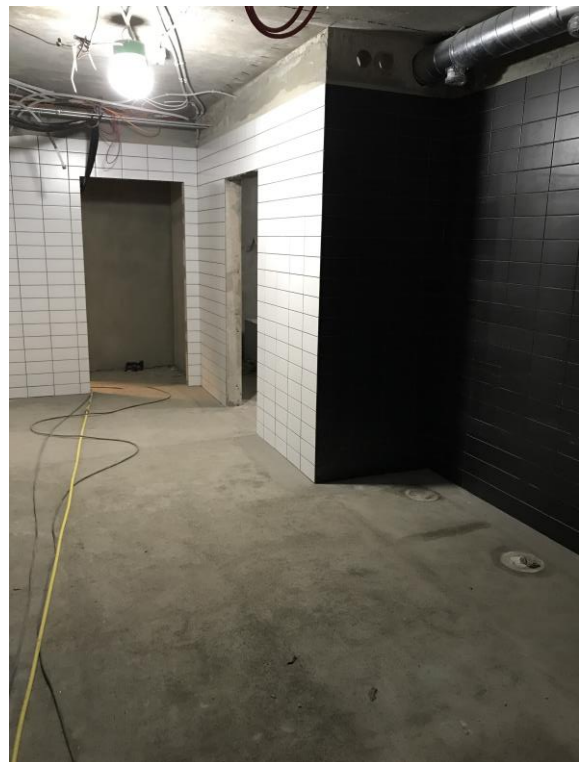
Kakel i duschrum