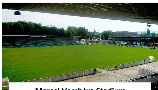
Marcel Verchère Stadium