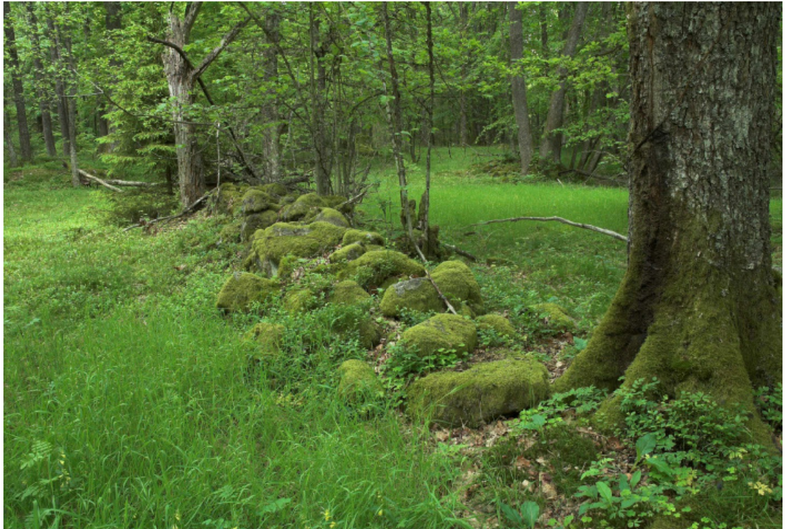
Älmås. Foto Dag Ekelund