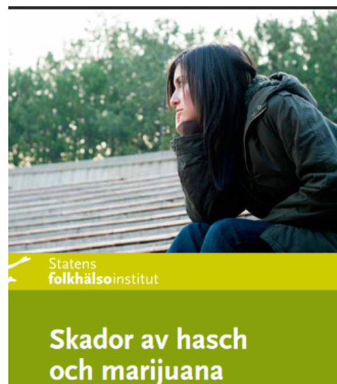
Här kan du ladda ned skriften Skador av hasch och marijuana